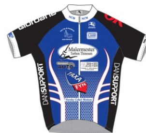
NU er det muligt at bestille tøj

Tilbagemeldinger til Palle Toft den 1. december – størrelser må vi finde ud af inden bestilling.