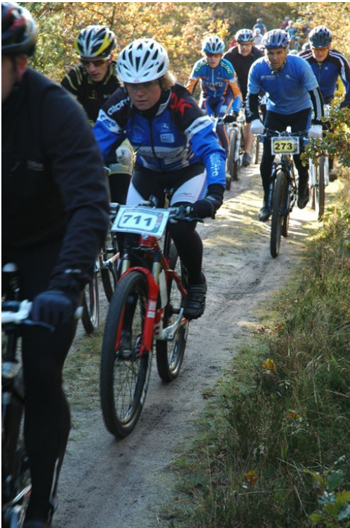
Stine efter starten