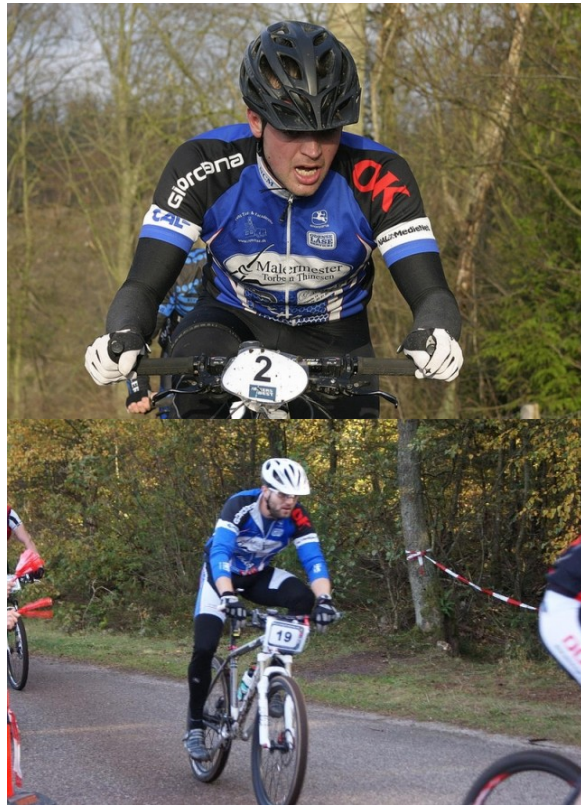
MTB'erne gir' den MAXGAS